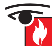
Tableau répéteur d'exploitation permettant le report à distance de la signalisation visuelle et sonore des différents états des ECS A 99.