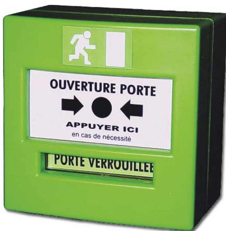
Anelec Déclencheur manuel vert pour issues de secours